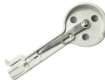
UL-8803 ( เครื่องมือเข้าสาย DROP WIRE แบบ 2 ระดับ )