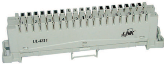
UL-4311 CONNECTION MODULE 10 PAIR รุ่นหน้าสัมผัสติดกัน เช็คสัญญาณได้ แต่บอกไม่ได้ว่าสัญญาณเข้าหรือออก