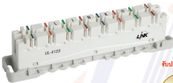
UL-4123 INTELLIGENT DISCONNECTION MODULE 8 Pair CAT6 (สำหรับระบบโทรศัพท์ใช้สาย LAN รองรับความทันสมัย)