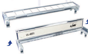
UL-4631 ป้ายชื่อพลาสติกโต เปิด-ปิด ไขนอกรีเลย์สาย