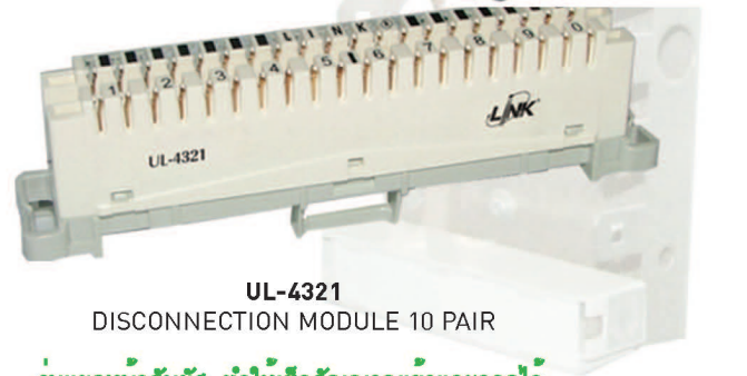
UL-4321 DISCONNECTION MODULE 10 PAIR รุ่นแยกหน้าสัมผัส ทำให้เช็คสัญญาณเข้าและออกได้