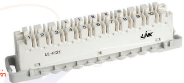
UL-4121 INTELLIGENT DISCONNECTION MODULE 10 Pair CAT6 (สำหรับระบบโทรศัพท์ที่ต้องการประสิทธิภาพที่เหนือกว่า)