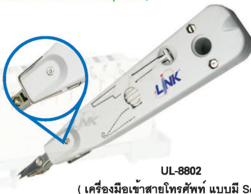
UL-8802 ( เครื่องมือเข้าสายโทรศัพท์ แบบมี Sensor )